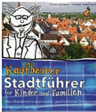
Kann von beiden Richtungen gelesen werden: Der Kaufbeurer Stadtführer für Kinder und Familien.