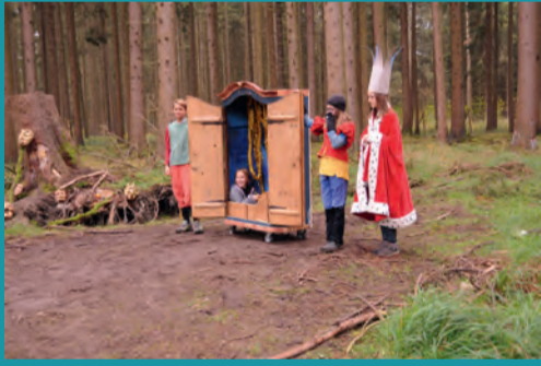
Reise durch den Märchenwald