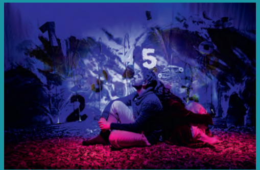
Und was kommt nach 1000?