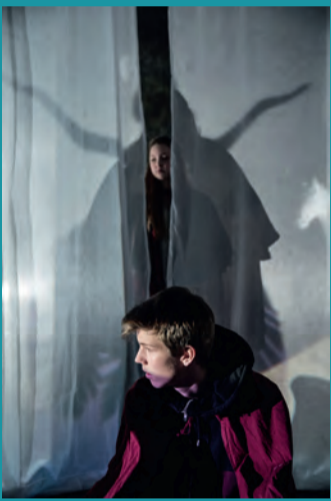
Die Brüder Löwenherz