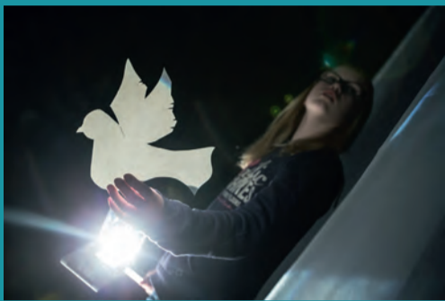
Die Brüder Löwenherz