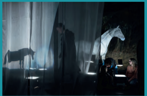
Die Brüder Löwenherz