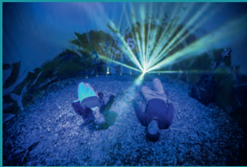
Und was kommt nach 1000?