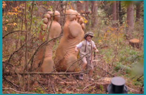
Reise durch den Märchenwald