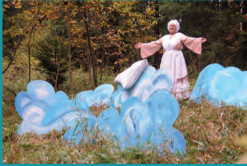
Reise durch den Märchenwald