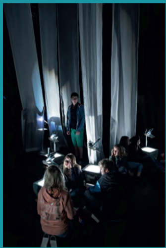
Die Brüder Löwenherz