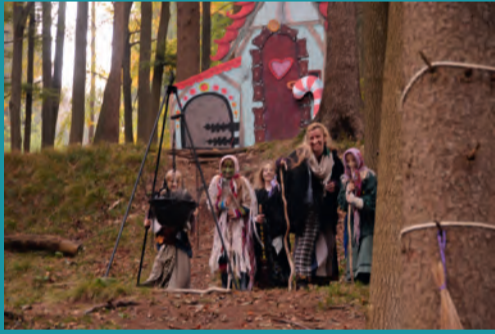
Reise durch den Märchenwald