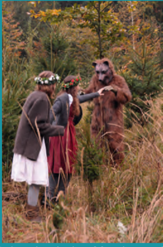
Reise durch den Märchenwald