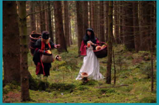
Reise durch den Märchenwald