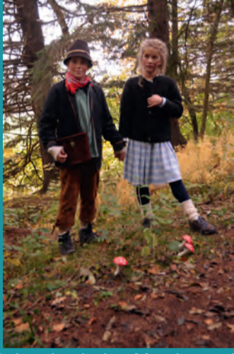
Reise durch den Märchenwald