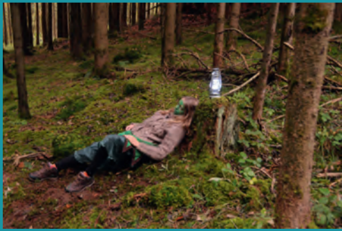
Reise durch den Märchenwald